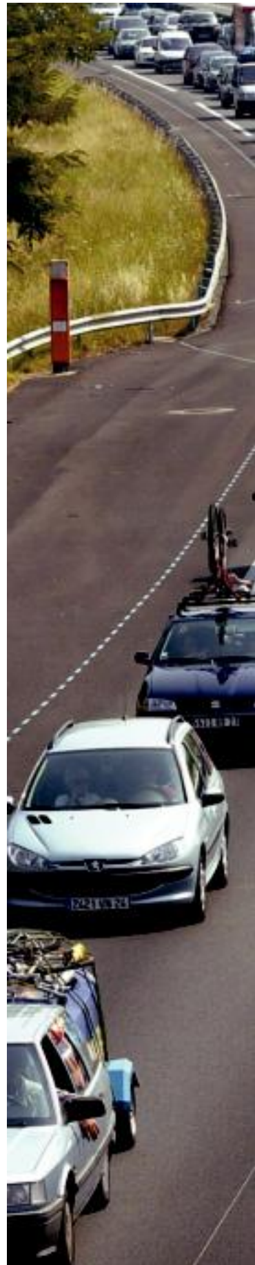
A-63 autobidean, Biriatuko ordainlekuaren bi aldeetan

Baiona-Angelu-Miarritze hirigutako autobus garraio zerbitzua berriz pentsatzea aipatu dute. Horrez gain, kostaldearen eta barnealde-