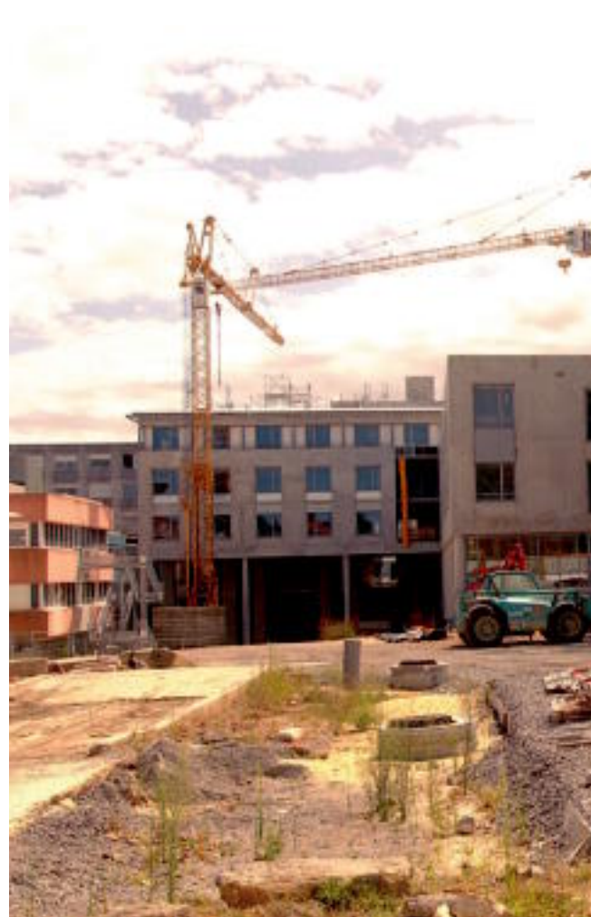
Baionako Ospitalean obra handiak egiten ari dira, eskaintza hobea eta zabalagoa ukan dezan. CA...